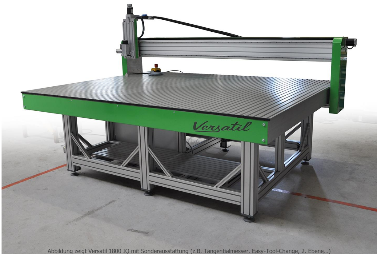
Abbildung zeigt Versatil 1800 IQ mit Sonderausstattung (z.B. Tangentialmesser, Easy-Tool-Change, 2. Ebene...)

Versatil kommt aus dem Lateinischen und bedeutet: beweglich, gewandt, vielseitig. Nicht umsonst trägt die Baureihe diesen Namen. Ob als Brennschneidemaschine, Wasserstrahlschneideanlage, mit 2. Tischebene für die Bearbeitung von großen Werkstücken, doppelter Z-Achse oder als Fräse. Die Möglichkeiten sind nahezu unbegrenzt.