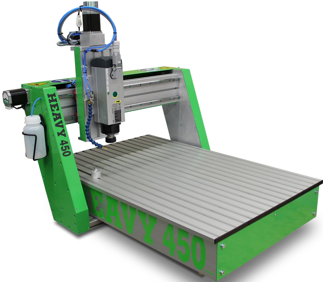
Abbildung zeigt Maschine mit Sonderausstattung

Die CNC Maschinen der HEAVY Baureihe sind für hohe Beanspruchungen ausgelegt. Verwendung finden sie in Industrie und Handwerk, in der Ausbildung, an Hochschulen oder im Labor. Die HEAVY kann mit umfangreichem Zubehör für die unterschiedlichsten Anforderungen ausgestattet werden.