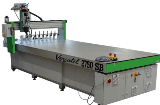
Versatil 2500 SB