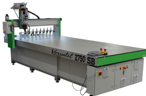
Versatil 2750 SB