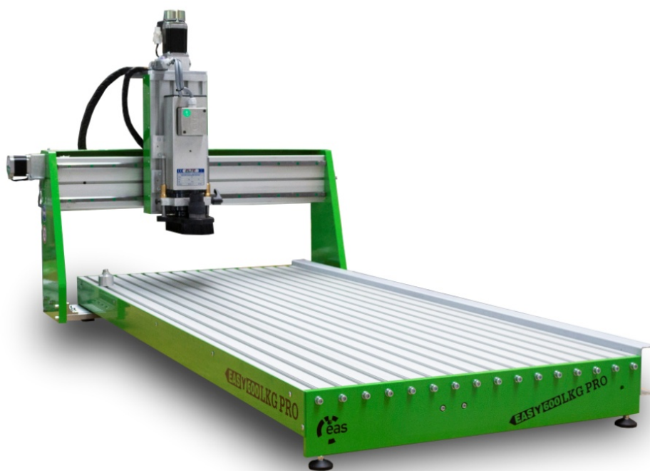
Abbildungen zeigt EAS(Y) 600LKG PRO

Die EAS(Y) KG PRO Baureihe ist die Weiterentwicklung der EAS (Y) Baureihe. Großzügig dimensionierte Seitenteile und Profile aus stranggepressten Industrieprofilen ermöglichen eine noch effizientere Bearbeitung verschiedenster Werkstoffe wie Holz, Kunststoff, GFK, CFK, Plexiglas, Dibond, Aluminium und Messing. Durch verschiedene Anbauteile an der Z-Achse kann Sie zum Fräsen, Gravieren, Folienschneiden, Isolationsfräsen, Dosieren und vieles mehr verwendet werden.