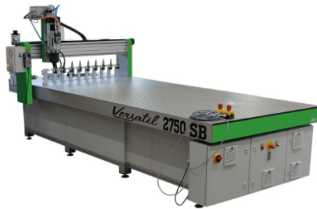
Versatil 2500 SB