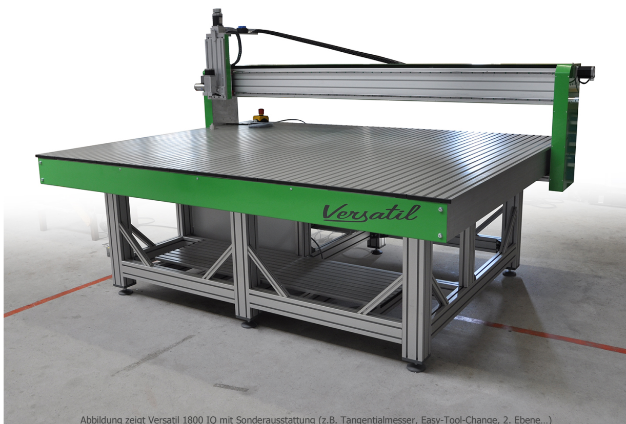
Abbildung zeigt Versatil 1800 IQ mit Sonderausstattung (z.B. Tangentialmesser, Easy-Tool-Change, 2. Ebene...)

Versatil kommt aus dem Lateinischen und bedeutet: beweglich, gewandt, vielseitig. Nicht umsonst trägt die Baureihe diesen Namen. Ob als Brennschneidemaschine, Wasserstrahlschneideanlage, mit 2. Tischebene für die Bearbeitung von großen Werkstücken, doppelter Z-Achse oder als Fräse. Die Möglichkeiten sind nahezu unbegrenzt.