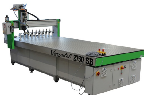
Versatil 2750 SB