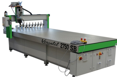
Versatil 2500 SB