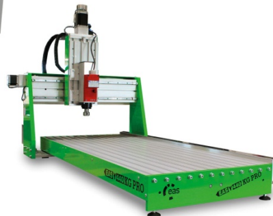
EAS(Y) 440 KG PRO