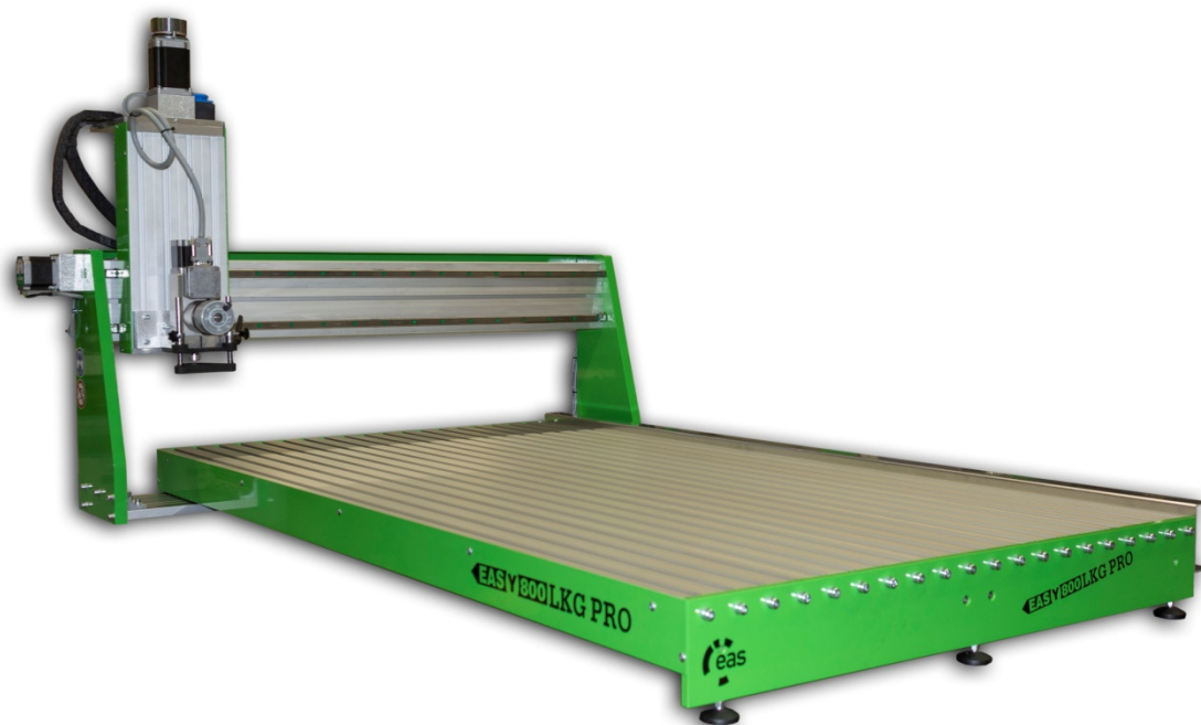
Abbildungen zeigt EAS(Y) 800LKG PRO mit Tangentialmesser

Die EAS(Y) KG PRO Baureihe ist die Weiterentwicklung der EAS (Y) Baureihe. Großzügig dimensionierte Seitenteile und Profile aus stranggepressten Industrieprofilen ermöglichen eine noch effizientere Bearbeitung verschiedenster Werkstoffe wie Holz, Kunststoff, GFK, CFK, Plexiglas, Dibond, Aluminium und Messing. Durch verschiedene Anbauteile an der Z-Achse kann Sie zum Fräsen, Gravieren, Folienschneiden, Isolationsfräsen, Dosieren und vieles mehr verwendet werden.