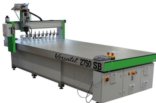
Versatil 2500 SB