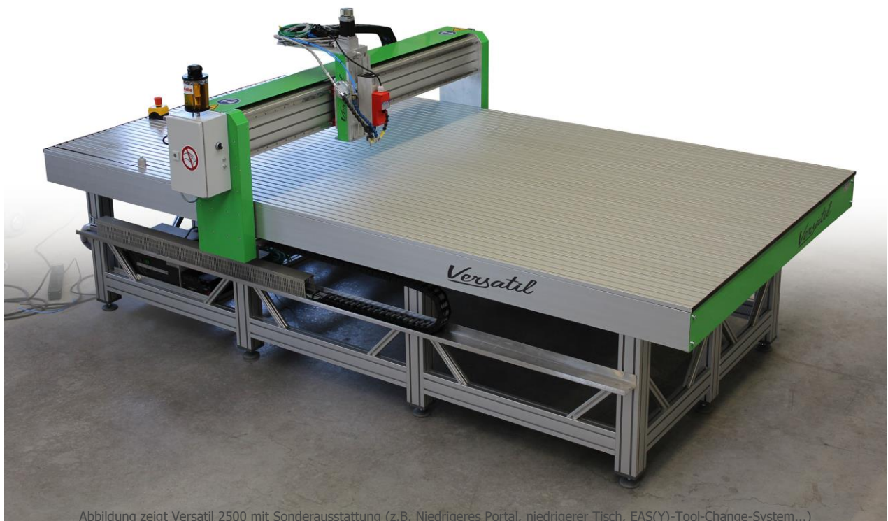
Abbildung zeigt Versatil 2500 mit Sonderausstattung (z.B. Niedrigeres Portal, niedrigerer Tisch, EAS(Y)-Tool-Change-System...)

Versatil kommt aus dem Lateinischen und bedeutet: beweglich, gewandt, vielseitig. Nicht umsonst trägt die Baureihe diesen Namen. Ob als Brennschneidemaschine, Wasserstrahlschneideanlage, mit 2. Tischebene für die Bearbeitung von großen Werkstücken, doppelter Z-Achse oder als Fräse. Die Möglichkeiten sind nahezu unbegrenzt.