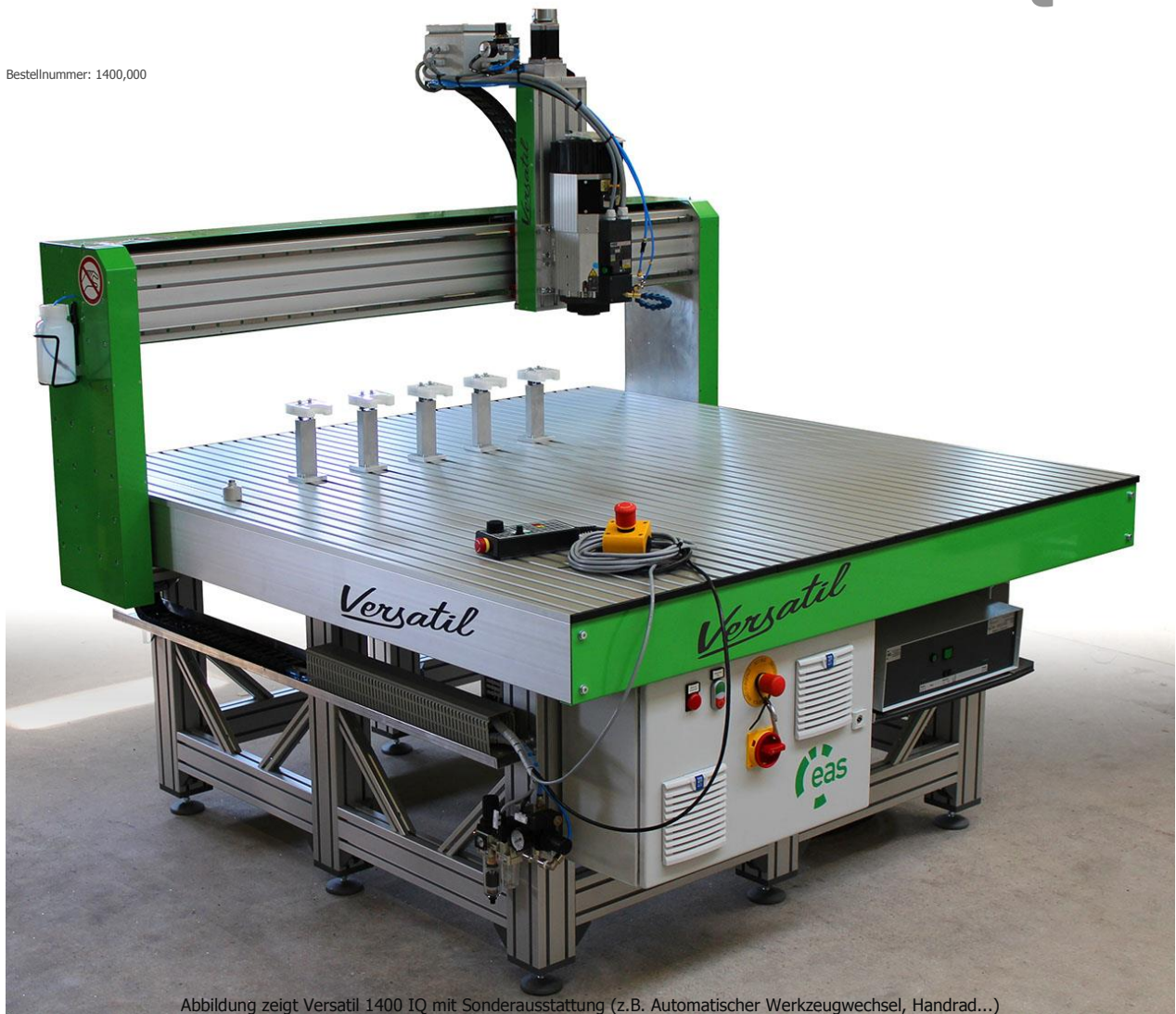
Abbildung zeigt Versatil 1400 IQ mit Sonderausstattung (z.B. Automatischer Werkzeugwechsel, Handrad...)

Versatil kommt aus dem Lateinischen und bedeutet: beweglich, gewandt, vielseitig. Nicht umsonst trägt die Baureihe diesen Namen. Ob als Brennschneidemaschine, Wasserstrahlschneideanlage, mit 2. Tischebene für die Bearbeitung von großen Werkstücken, doppelter Z-Achse oder als Fräse. Die Möglichkeiten sind nahezu unbegrenzt.