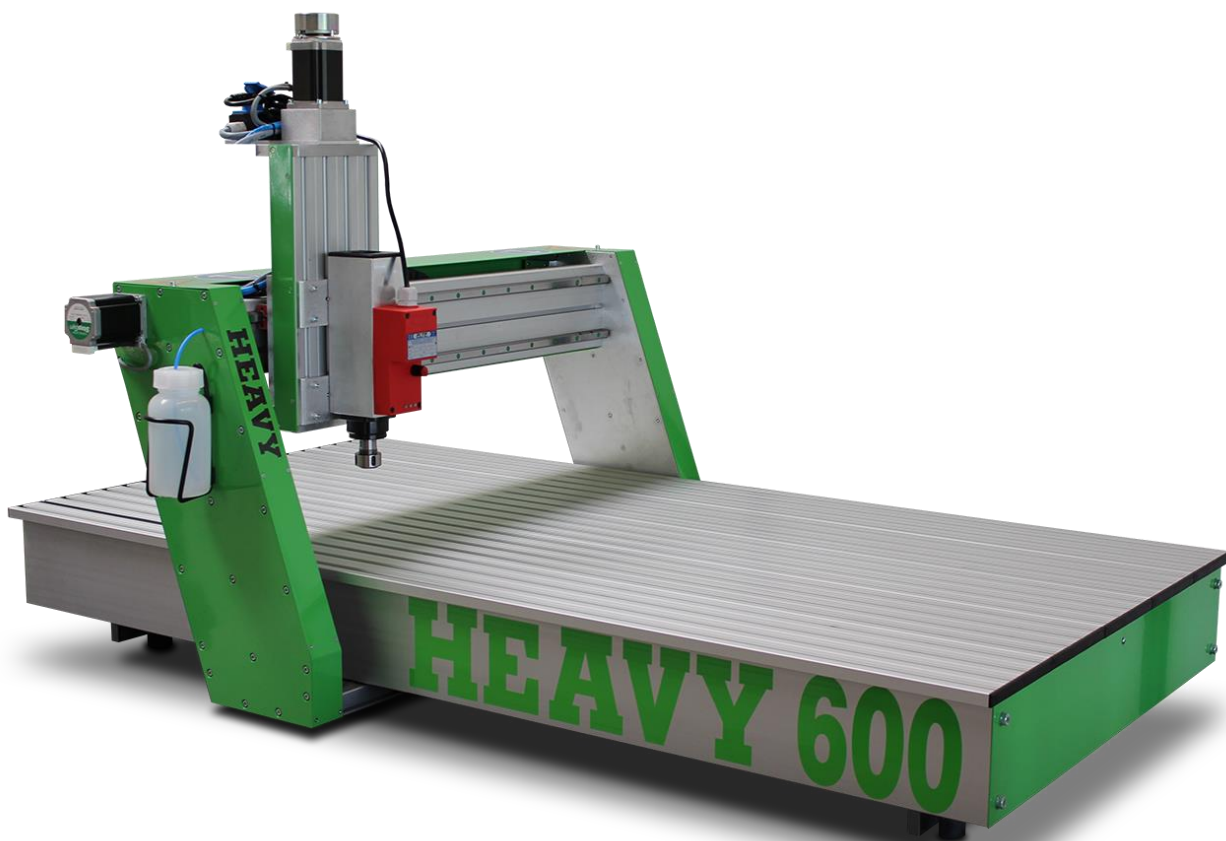
Abbildung zeigt Maschine mit Sonderausstattung

Die CNC Maschinen der HEAVY Baureihe sind für hohe Beanspruchungen ausgelegt. Verwendung finden sie in Industrie und Handwerk, in der Ausbildung, an Hochschulen oder im Labor. Die HEAVY kann mit umfangreichem Zubehör für die unterschiedlichsten Anforderungen ausgestattet werden.